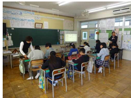
【6年算数：拡大図と縮図】

今年度、黒保根小は『進んで交流し、表現できる児童』を目指して、全職員で研修に取り組んでいます。音楽の授業では、ペアになり、自分の作った旋律を聴いてもらったり、相談したりしながら音楽作りに取り組んでいました。算数の授業では、自分で考えた拡大図を書く方法を、グループや全体で発表していました。これからも、子どもたちのコミュニケーション能力を伸ばすことができるよう、研修を進めていきたいと思ひます。