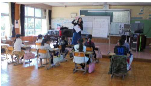
【5年音楽：日本と世界の音楽に親しもう】

子どもたちが一生懸命に考えたり、自分の考えを発表したりと、熱心に学習に取り組む姿が見られ、市教委の先生方も子どもたちの真剣さに感心していました。