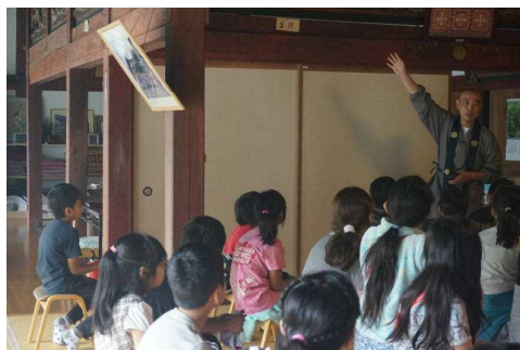
【空井さんのお話を聞いています】

18日(金)は、今年度初めての西町インターナショナルスクールとの交流がありました。今回の『初対面交流』は、黒保根小の5年生と西町の4年生(秋から5年生に進級)の、これから4年間続く交流の第1回目、最初の交流になります。西町の4年生58名は2泊3日のキャンプの最終日でした。黒保根小は、4年生と6年生も一緒に西町を迎えました。4年生にとっては、初めての西町交流で、楽しみにしていた子どもも多かったよう