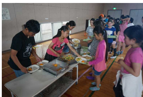
【配膳も協力してできました！】

学校へ戻ったあとは、グループに分かれてスポーツ交流をしました。この日のために、5年生が交流の内容などについて計画をしていてくれました。遊び方やルールについて英語で説明をし、積極的に交流する様子が見られました。西町の子もたちは、普段は広いグラウンドで遊ぶ機会がないようで、黒保根小の広い校庭を思い切り駆けまわっていました。短い時間でしたが、みんなで楽しく過ごすことができました。