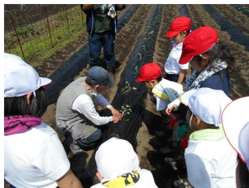
【サツマイモの苗植えの様子】