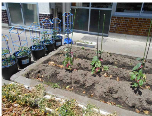
【学級園のナス・ピーマン・ミニトマト】

育てる中で、たくさんの方に気づいたり、いろいろなことを感じてくれると思います。子どもたちの収穫の喜びを楽しみにしたいと思います。