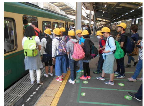
【江ノ電に乗ります】