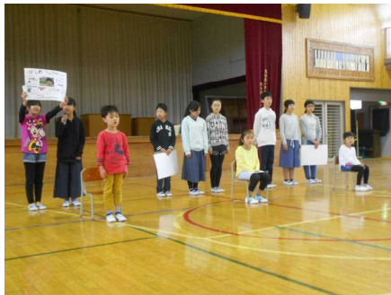
【6年生が一人一人を紹介してくれました】