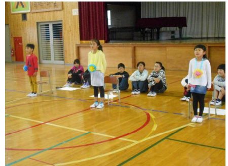
【元気よく校歌を歌うことができました】

入学して3週間、バスでの登下校、いろいろな教科の学習、楽しい給食の時間など、少しずつ経験を重ねながら、学校生活のリズムもつかめてきているようです。5月から