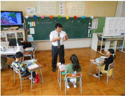
【1年算数・10までのかず】

20日(金)に第1回授業参観及び平成30年度PTA総会、学校・学級懇談会を開催させていただきました。お忙しい中、たくさんの保護者の方々に御参加いただきました。