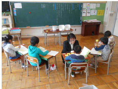
【2年国語・ふきのとう】