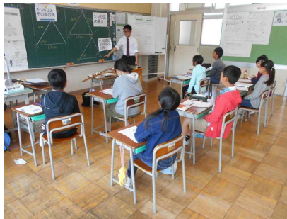
【5年算数・図形の合同】