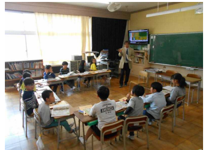
【3年社会・わたしたちのまち】