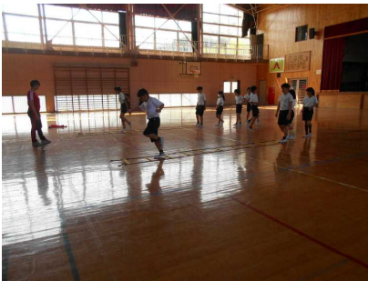
【4年体育・体づくり運動】