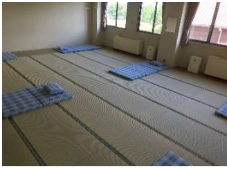
和室1.2 定員 6名