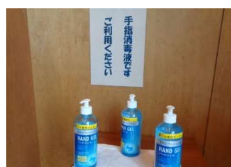
プレイホール玄関付近