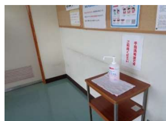
二階談話コーナー付近