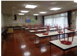
食堂 定員 32名