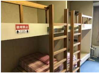
宿泊室1.2.3 定員 4名