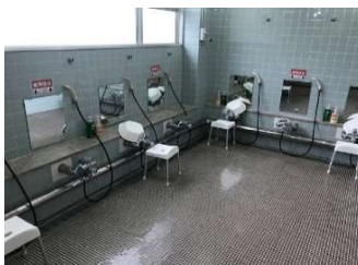
大浴室 定員 6名